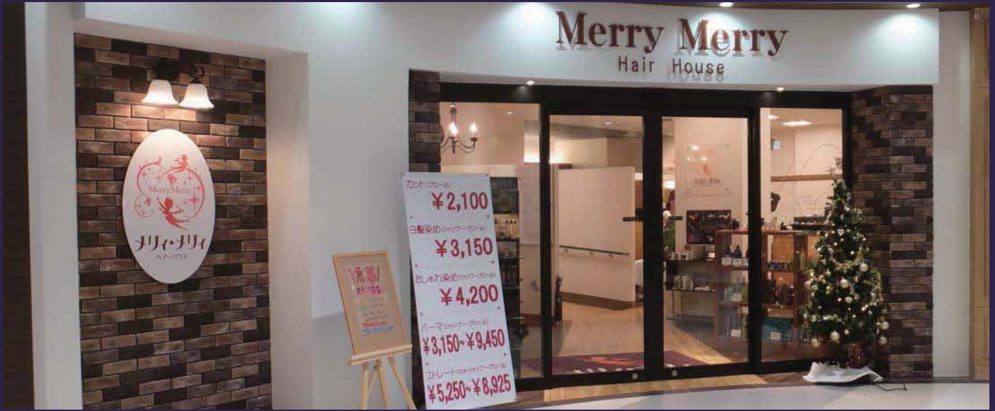
白いフレームに古レンガ調のタイルと合わせたシンプルなデザイン。