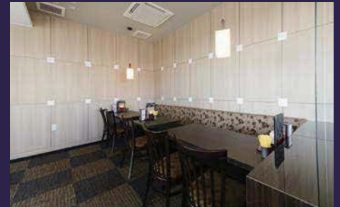
落ち着いた雰囲気の喫煙席スペース。