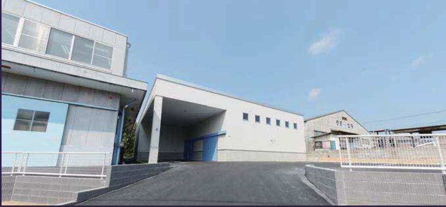
イメージ通りの外観デザインに仕上がりました。

トーシック様本社社屋と同一敷地内にある老朽化した倉庫を解体し、倉庫の新築と外構整備（駐車場・アプローチ・サイン等）をする計画でスタート。営業しながらの工事であるため工程管理・安全対策等のソフト面、倉庫の機能を十分満たすように耐久性と耐候性等に重点を置いたハード面、あらゆる面に配慮しながら計画・工事を進めました。さらに、本社社屋と調和のとれた色彩計画と敷地内全体を再整備することにも配慮しました。