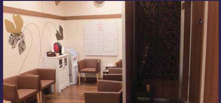
待合室の壁は普通のクロスにシートで草花をデザイン。

デリスクエア(旧ピアゴ今池店)の2階コーナースペースに計画されたヘアサロン。コーナーの特性を活かして大きな円弧の入り口から左右に待合室とカットスペースを振り分けた。