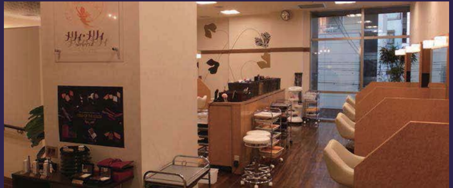
オープンとともに多くのお客様をお迎えしています。