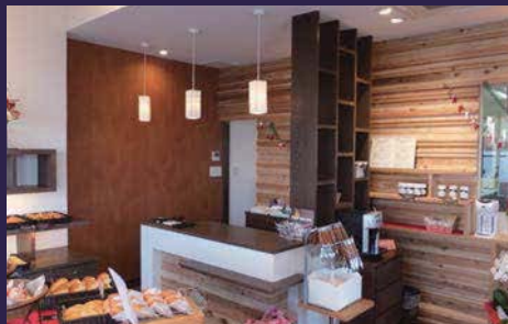
木の暖かみを感じる落ち着いた雰囲気。