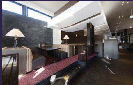
ダイナミックに連続する室内の庇。