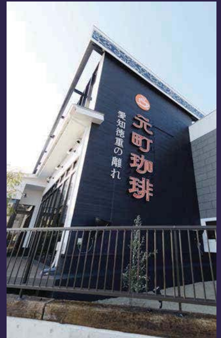
建物の高さがあるので、外壁に設置されたサインも視認性抜群。