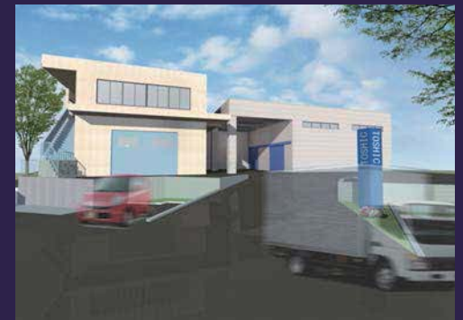
パースを作成し、建物の外観を確認しました。

トーシック様本社社屋と同一敷地内にある老朽化した倉庫を解体し、倉庫の新築と外構整備（駐車場・アプローチ・サイン等）をする計画でスタート。営業しながらの工事であるため工程管理・安全対策等のソフト面、倉庫の機能を十分満たすように耐久性と耐候性等に重点を置いたハード面、あらゆる面に配慮しながら計画・工事を進めました。さらに、本社社屋と調和のとれた色彩計画と敷地内全体を再整備することにも配慮しました。