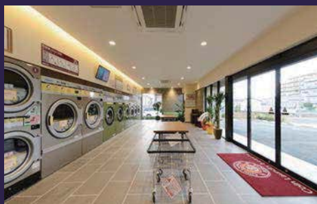
清潔感のある内装に仕上がった。