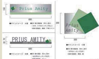
マンションネームのバリエーション案。

プリウス・センソシテ 共同住宅新築工事 マンションサイン 2013.10.10 (木)