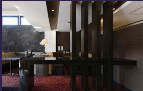
間仕切りの絶妙な開放感により、広がり落ち着いた客席。

建物は通りに対して斜めに配置され、残された三角地帯が庭となることで、客席に広がり豊かさを与えます。内部は港町元町の異国情緒と和の融合がコンセプト。くつろぎと癒しの本物空間を一度体感してください。