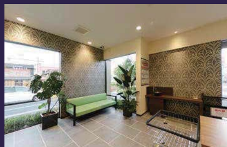
広々とした待機スペース。