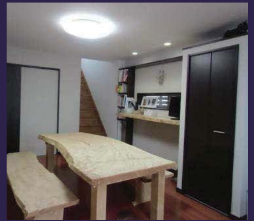
存在感のある銘木ダイニングセット。窓際のカウンターも銘木です。