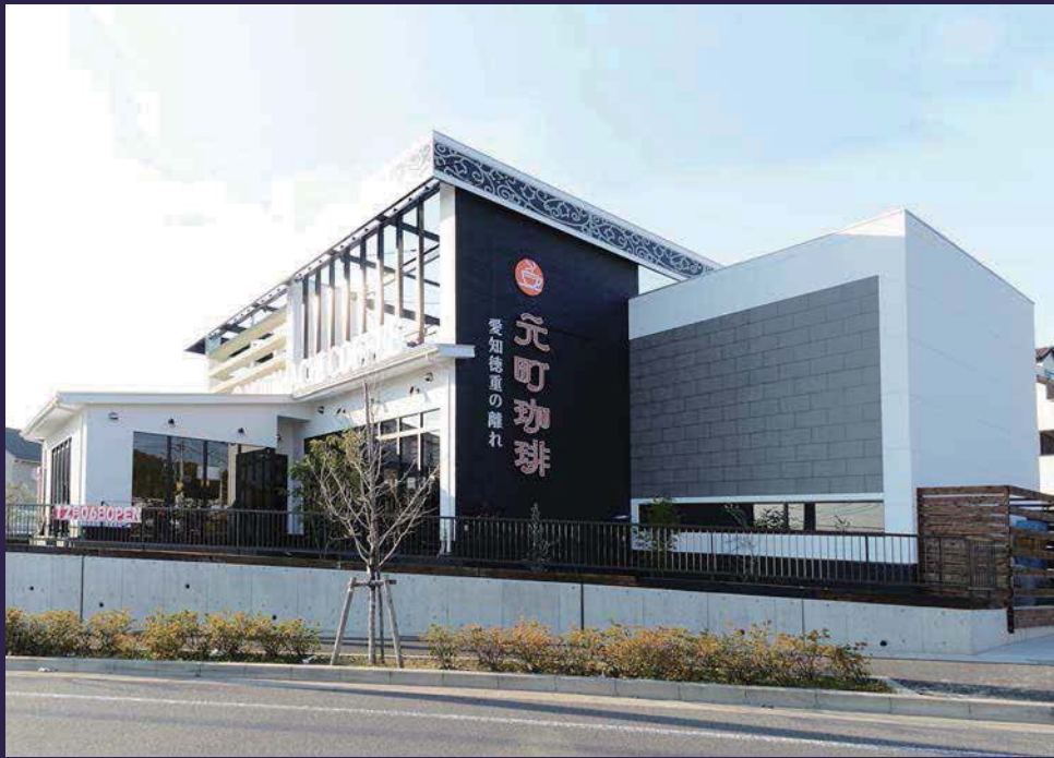
メインストリートから見る全景。平屋建てとは思えないボリューム感。