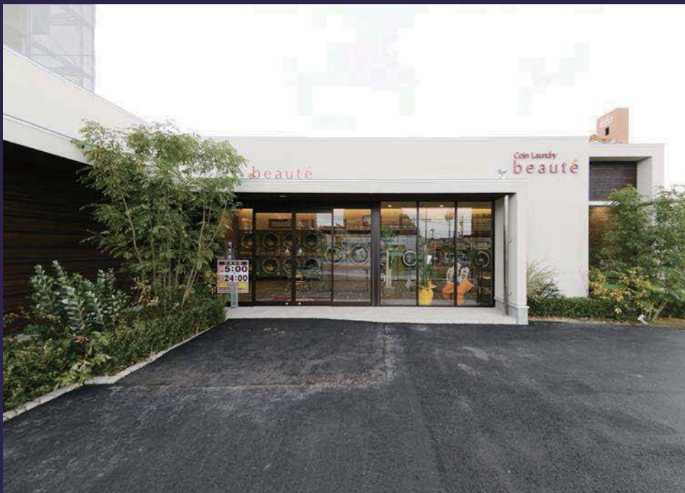
白を基調とした綺麗なシンプルデザイン。