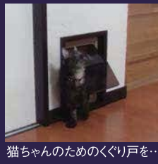
猫ちゃんのためのくぐり戸を...