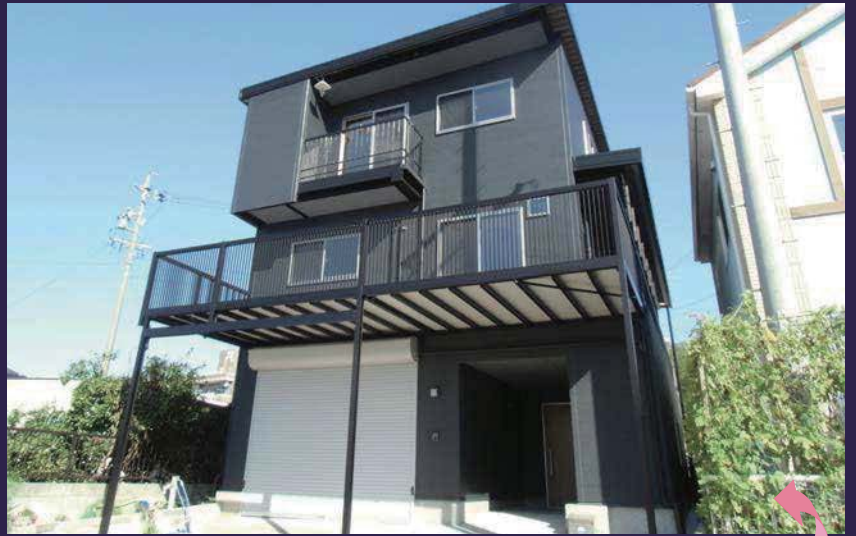
黒を基調としたシックな佇まい。

コストを抑えるためもあり、改装の範囲を基本性能を上げる断熱とペアガラスサッシ、生活のメインとなる1・2階部分に絞って行いました。