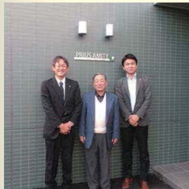
オーナー様との記念写真をバッチリ!!

プリウス・センソシテ 共同住宅新築工事 マンションサイン 2013.10.10 (木)