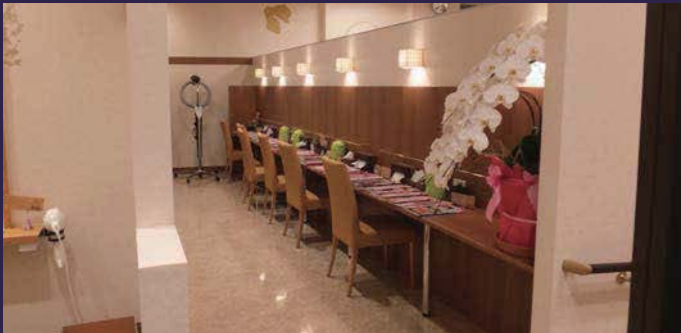
シャンプー・コールドスペースは区画されて見えないように配慮。