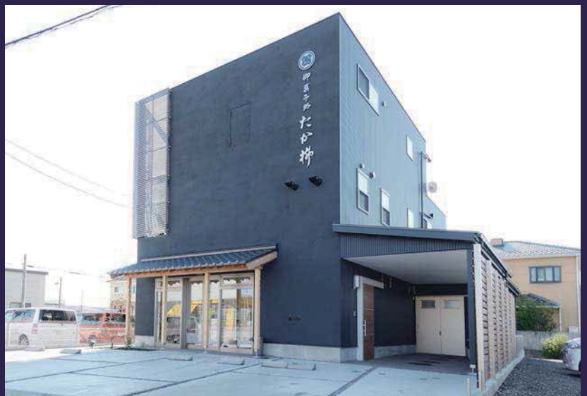
モダンなデザインで統一された外観。

以前からお世話になっている設計事務所様からご紹介頂いた物件です。設計事務所様と施主様は色々なこだわりをお持ちで、高い窓の位置・無垢の床材・建具枠をつけないシンプルな内装と、シックにまとめた外観には感銘を受けました。施主様の店舗部分にかかる情熱や作業スペースのこだわりなど、仕事に対する妥協しない姿勢に応えようと要求を頂いたことには、ほぼ応えられたと思います。