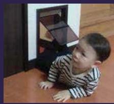
息子さんもスレリ。楽しそう!!