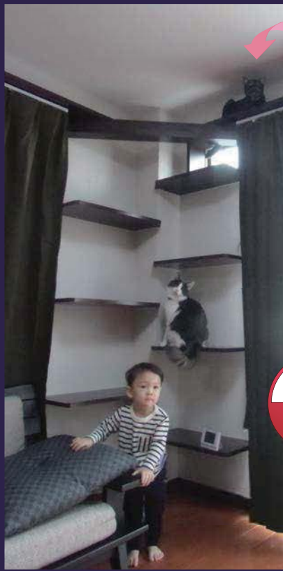
コーナーの柱型を利用して作ったキャットタワー。