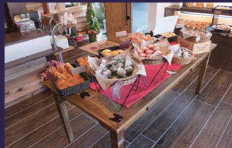
美味しいパンをより惹きたてる木のテーブル。

長久手市の西エリア、藤が丘に程近い場所に「コインランドリーボーテ」が誕生しました。当社では2棟目となりましたが、今回はFC加盟店様との御縁です。新規出店毎に進化していく「コインランドリー」ですが、この度は土地の諸条件を考慮し、パン屋さんとのコラボレーションとなりました。店舗デザインはFC店オーナーのお義兄さん、パン屋オーナーは従兄さんと色々な繋がりからできたお店です。コインランドリーとは思えないオシャレな外観が一際目を引く、街並みに溶け込む建物です。