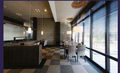
異国情緒溢れる内装。ウッドブラインドから優しい光が差し込む。