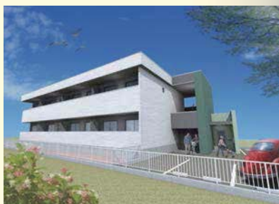
外観パースを幾つも作成し、仕様等を決定していきました。